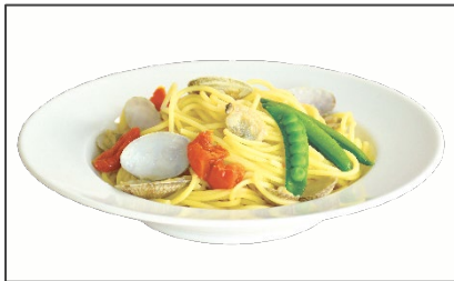
パスタ スナップエンドウとトマトのボンゴレ 980円（税込） (Pasta Snap Pea and Tomato Vongole)

セガフレードオリジナルのピザ生地を使って、ナポリの名物料理「ポルポ・アッフォガート(タコの溺れ煮)」を再現。タコのマリネと自家製トマトソースを使用し、さっぱりとしたテイストに仕上げました。