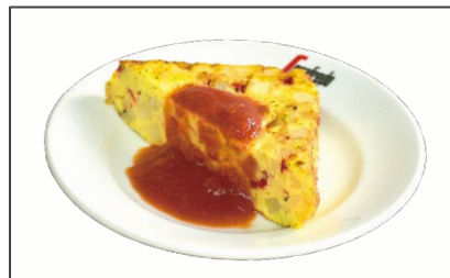
アンティパスト イタリアンオムレツ 550円（税込） (Antipasto Italian Omelette)

安定した人気があるきのこのチーズクリームに、春野菜の定番である、菜の花をトッピング！レモンを添えて、さっぱりとしたテイストに仕上げました。