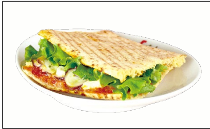
ピッツァサンド タコのトマトマリネ 780円（税込） (Pizza Sand Octopus Tomato Marinade)

セガフレードオリジナルのピザ生地を使って、ナポリの名物料理「ポルポ・アッフォガート(タコの溺れ煮)」を再現。タコのマリネと自家製トマトソースを使用し、さっぱりとしたテイストに仕上げました。