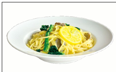
パスタ 菜の花ときのこのチーズクリーム 960円（税込） (Pasta Rapini & Mushroom Cheese Cream)

春に旬を迎えるアサリを使った、定番のボンゴレ。春野菜のスナップエンドウと、アクセントとしてドライトマトを加え、イタリアンカラーに仕上げました。