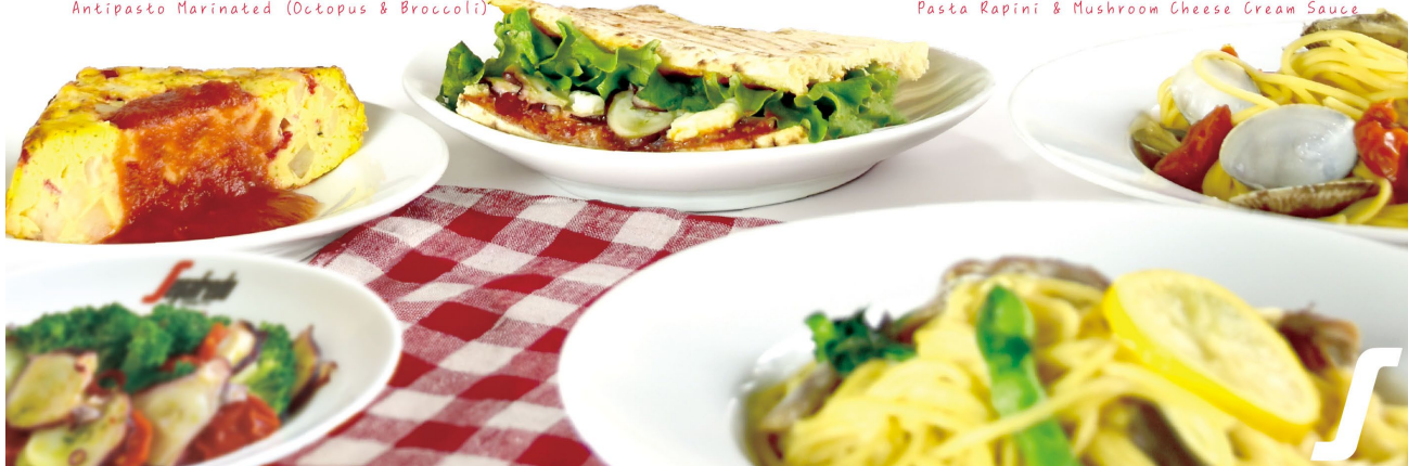
Pasta Snap Pea & Tomato Vongole Pasta Rapini & Mushroom Cheese Cream Sauce

イタリアンカラーの「緑」「白」「赤」を食材に取り入れた春季の新作メニューたちは、鮮やかな見た目が食欲をそそること間違いなし！